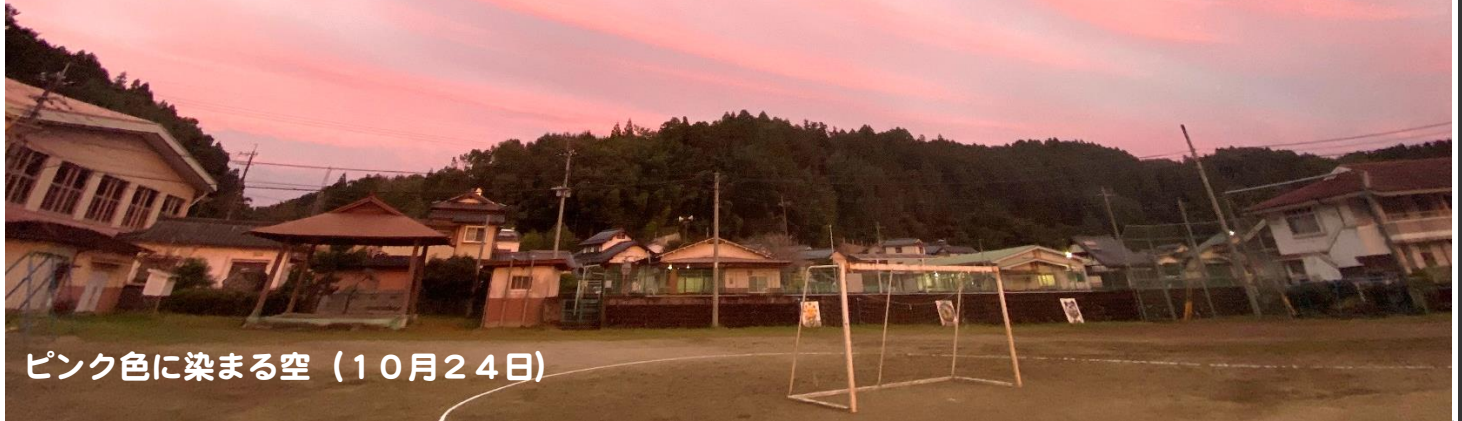
ピンク色に染まる空 (10月24日)