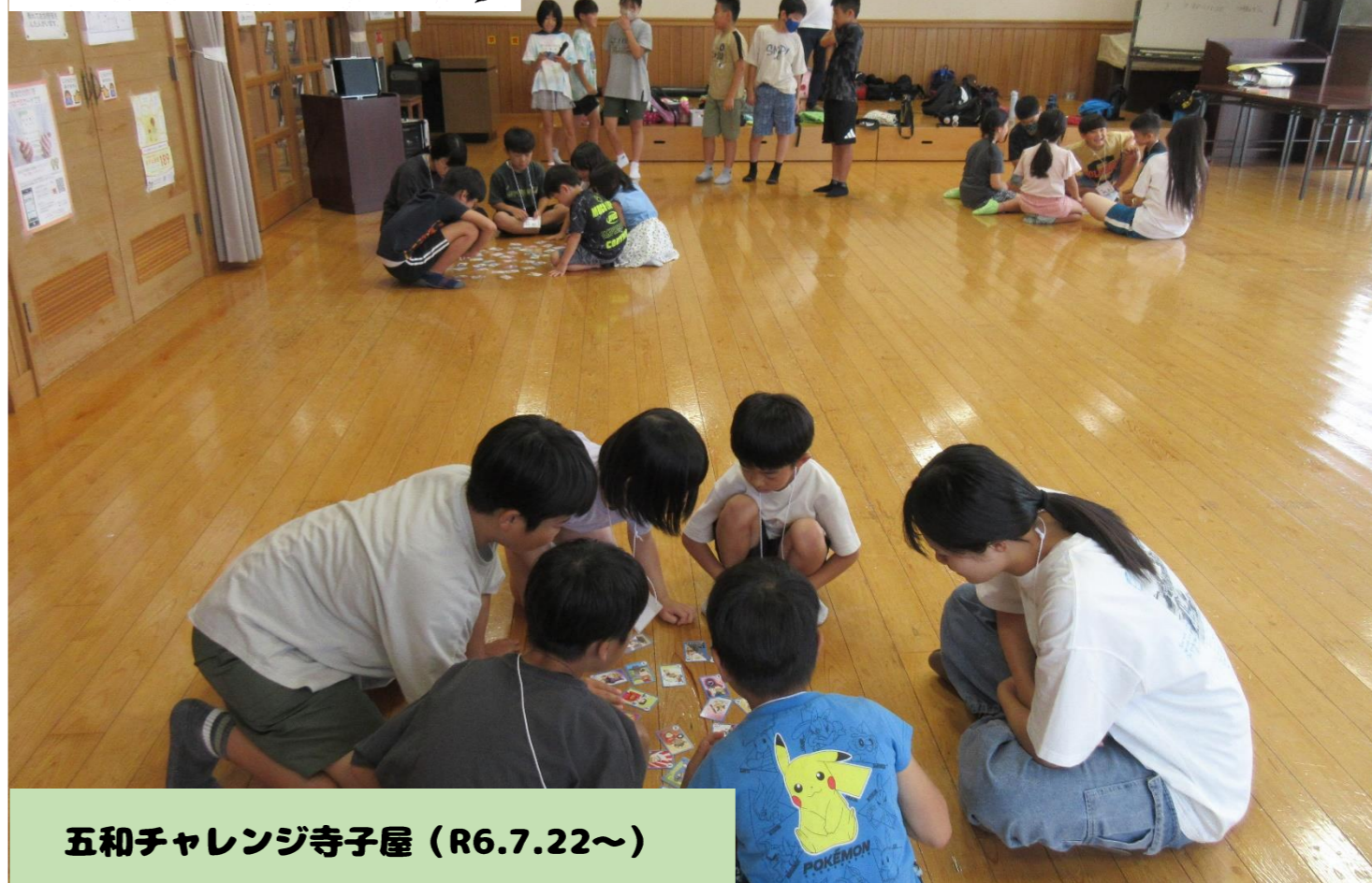
五和チャレンジ寺子屋 (R6.7.22~)

7月22日(月)に開催されました第1回五和ふるさと祭り実行委員会におきまして、五和ふるさと祭りの開催が決定いたしました。約5年ぶりの祭り開催となりますので、これから協議を重ね、決定事項は随時お知らせしていきます。また、祭りの出演・出店・出展の参加申込票を回覧版にて回します。参加ご希望の方は参加申込票を公民館までお持ちいただきますようお願いいたします。また用紙をご希望の方は各自治会長もしくは五和公民館までご連絡ください。