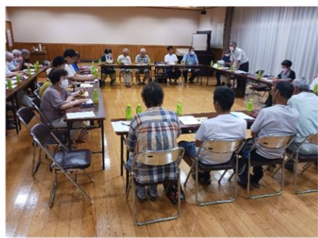
【第2回五和ふるさと祭り実行委員会の様子】

抽選券がついた五和ふるさと祭りのチラシは10月中旬ごろに全世帯に配布予定です。抽選券がついておりますので、無くさないようにご注意ください。 (チラシの再発行はできかねます。ご了承ください)