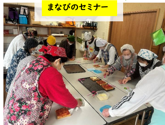
まなびのセミナー

1月14日(火)にぴいたあパンの家でパン作りを行いました。メロンパン、創作パン、ピザパンの3種類を作りました。創作パンは亀やうさぎの可愛いパンができました。