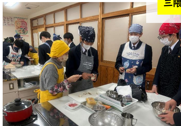
三隈中学校調理支援

1月15日~21日まで20:如月会さんが、三隈中学校での団子汁作りの調理支援に行きました。団子の作り方やゴボウの洗い方、野菜の切り方など丁寧にご指導くださったようです。団子汁も美味しくできたようで、また普段なかなか接することのない中学生と一緒に調理を行い、『楽しかったです』ともおっしゃっていました。20:如月会のみなさん、ありがとうございました。