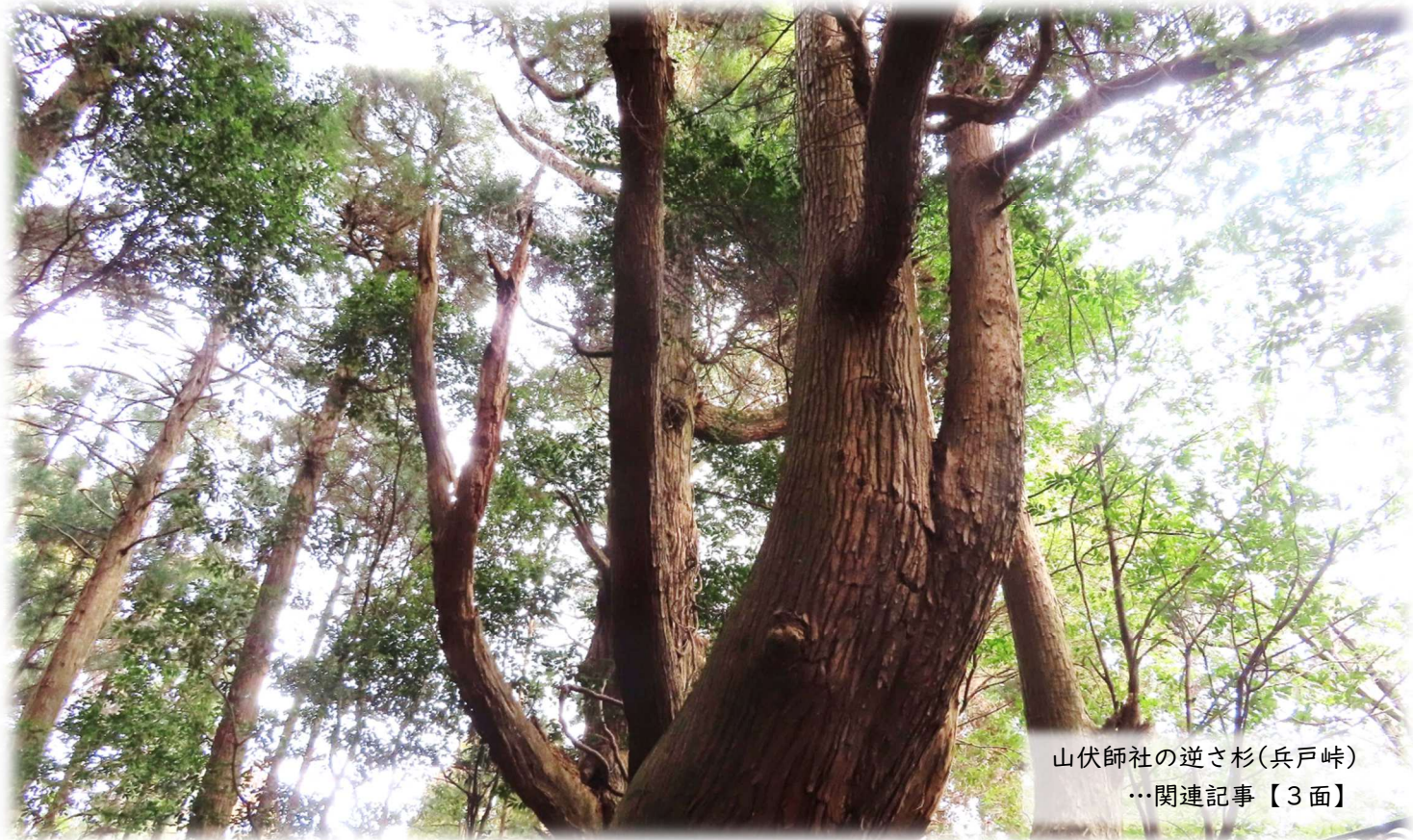
山伏師社の逆さ杉(兵戸峠) …関連記事【3面】