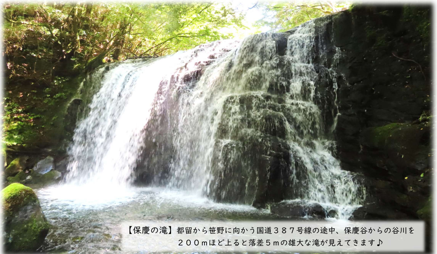
【保慶の滝】都留から笹野に向かう国道387号線の途中、保慶谷からの谷川を200mほど上ると落差5mの雄大な滝が見えてきます♪