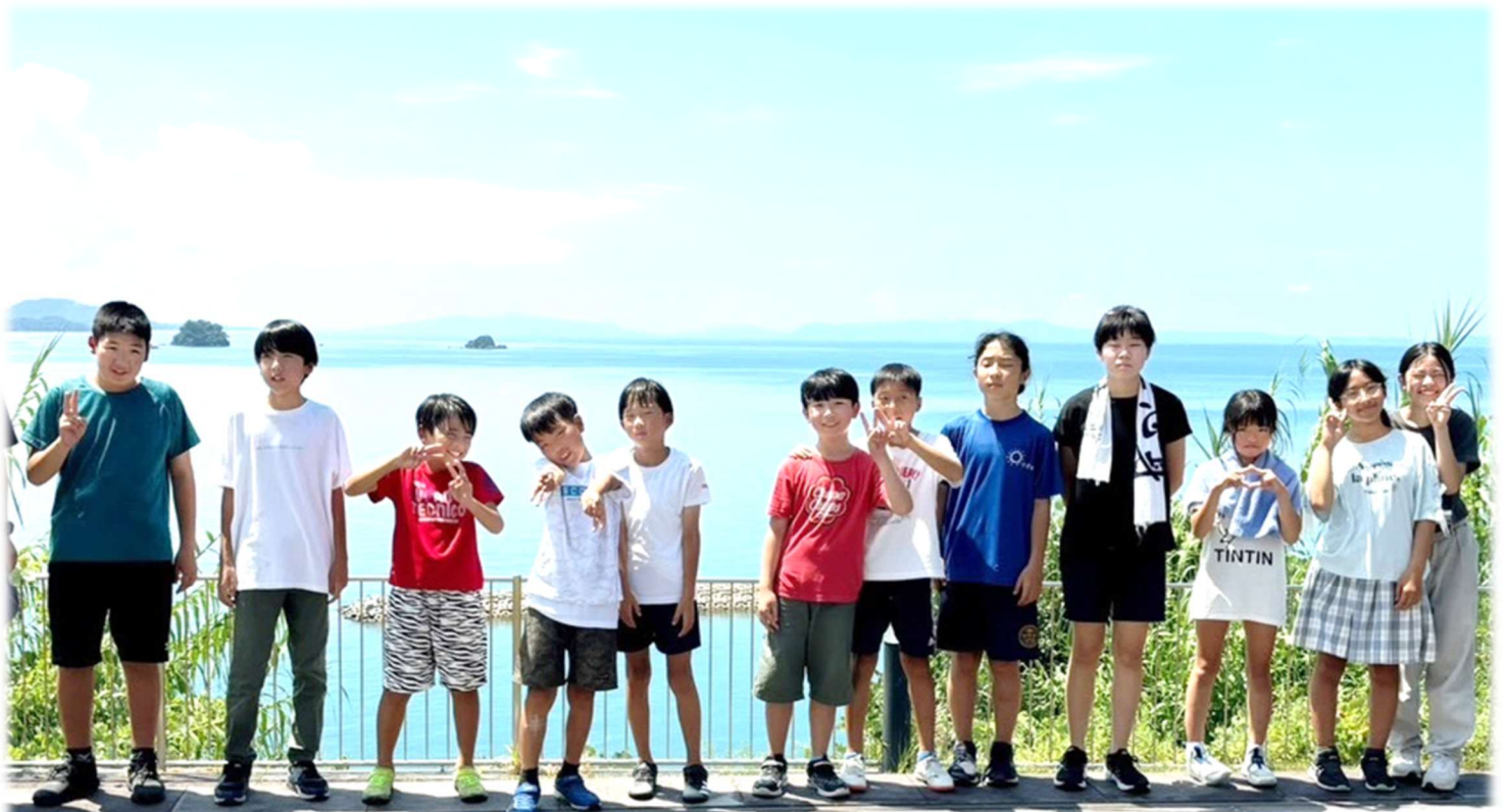
津江っ子チャレンジクラブ「サマーキャンプ in あしきた」…関連記事【3面】