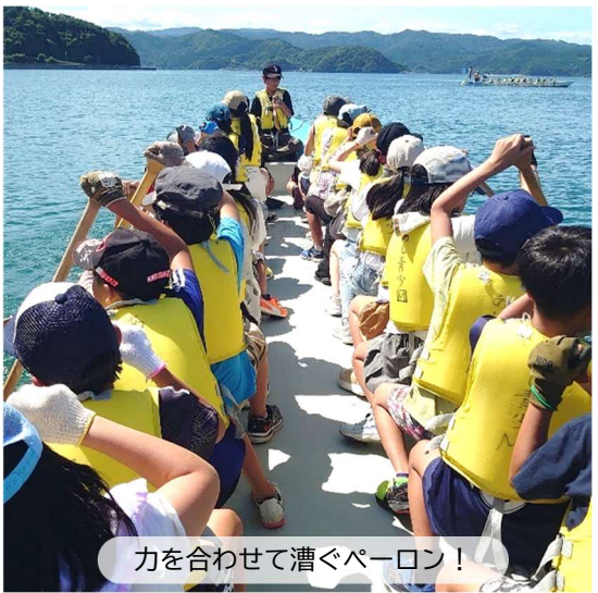
力を合わせて漕ぐペーロン！