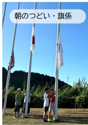
朝のつどい・旗係