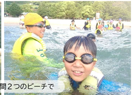
海水浴は2日間2つのビーチで