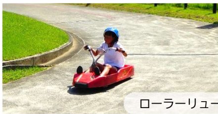
ローラーリージュ♪

8月に開催したカヌー体験教室とサマーキャンプでは、津江中学校7・8年の4名にボランティアとして参加してもらいました。様々な活動の中で小学生を引っ張り、サポートしてもらいました。ありがとうございました。これからのご活躍を期待しています！