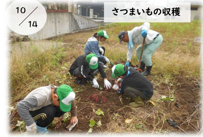
10/14 さつまいもの収穫

学校協働事業で、三和小5年生の家庭科支援ボランティアの活動がありました。多くの児童が初めてのミシンに戸惑っていましたが、ボランティアの方々の指導でコツをつかみ、徐々にスムーズに操作できるようになりました。