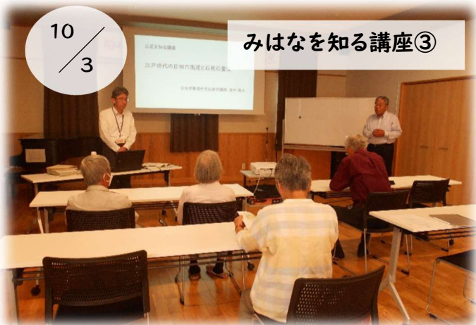
10/3 みはなを知る講座③

石坂石畳道ウォーキング大会の第1回実行委員会を開催しました。大会の準備や運営について話し合い、参加者が楽しめるイベントとなるよう意見を交換しました。