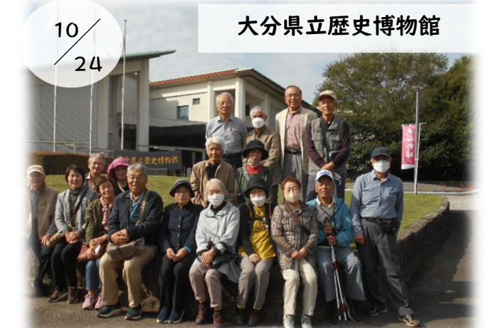
10/24 大分県立歴史博物館

みはな女性セミナーの一日研修で、通潤橋・通潤橋資料館・熊本城へ。通潤橋は江戸時代に白糸台地の水不足を解消するために1854年に建設された石橋で令和5年に国宝に指定されました。放流は圧巻でした。