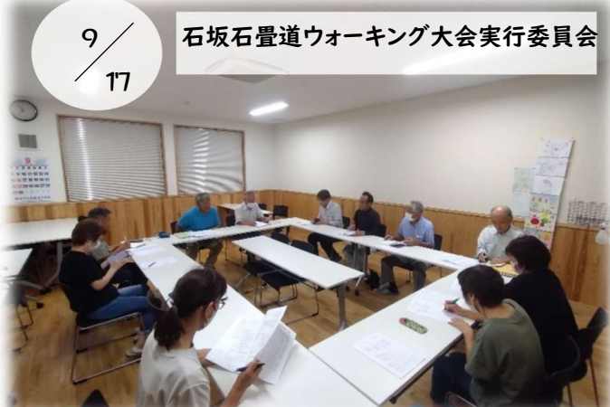
9/17 石坂石畳道ウォーキング大会実行委員会

高齢者との交流ボッチャ体験をしました。ルールを動画で学んで体験。この日はKCVの取材もありました。三花地区女性連絡協議会の方が作ったおいしいカレーライスを頂き、参加者同士の交流も深まりました。