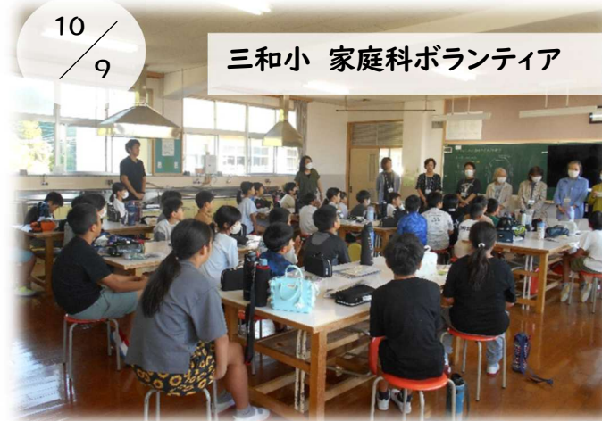
10/9 三和小 家庭科ボランティア

男の料理教室第5講が開催されました。今回のメニューは、さつまいもとリンゴの重ね煮、鮭のちゃんちゃん焼き、ゴボウ豚天、さつまいもごはんの4品でした。参加者は楽しく料理を学び、美味しい料理を作ることができました。