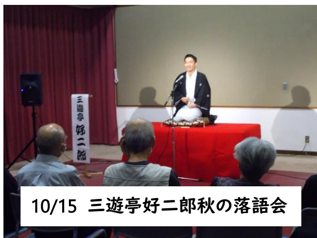
10/15 三遊亭好二郎秋の落語会

いろいろチャレ特別講座のおてあて体験では、川崎先生にセルフメンテナンスのやり方を教えていただきました。毎日のふとした瞬間に思い出して、自分を癒してあげましょね🍊