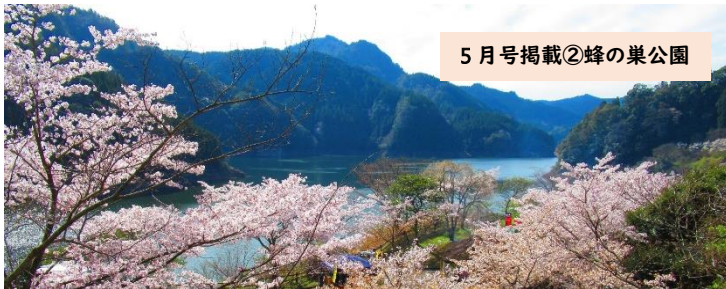
5月号掲載②蜂の巣公園