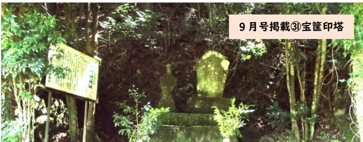
9月号掲載③宝篋印塔

今年度より中津江公民館だよりの表紙にしばしば掲載しています、中津江村内各地の名所。