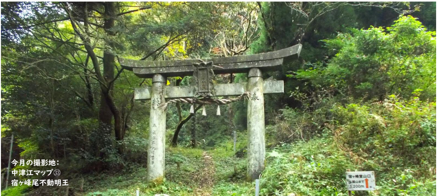
今月の撮影地： 中津江マップ③③ 宿ヶ峰尾不動明王

現在の中津江村 (2024/9/30時点) ●人口 599人 ●世帯数 304世帯