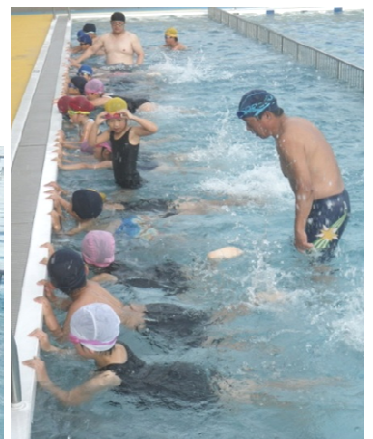
みんなよくがんばりました!!