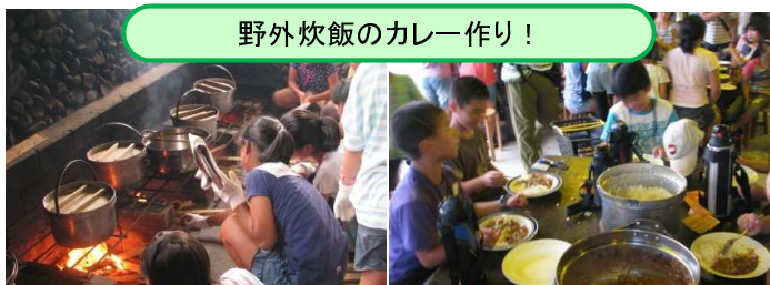
野外炊飯のカレー作り!