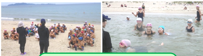
2日目3日目の海水浴!!