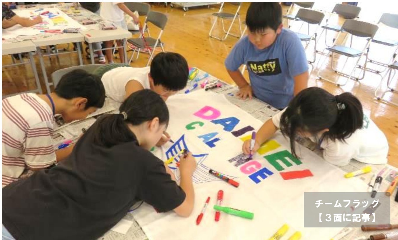
チームフラッグ 【3面に記事】

令和6年7月1日 (発行) 日田市夜明公民館 夜明中町 1547 tel27-2122 fax26-6878