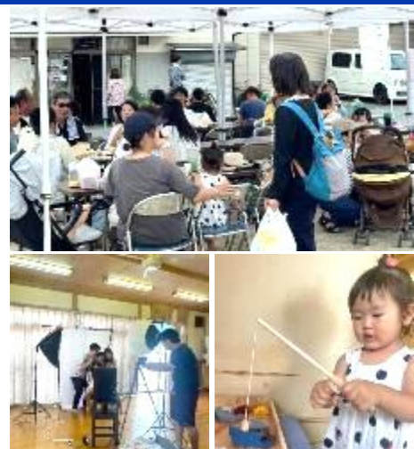
楽しむ子どもたち

公園内では飲食やハンドメイドなどの出店があったほか、今山公民館の中ではセルフ写真館、射的や輪投げなどの子ども縁日が催され、子どもたちはとても楽しんでいました。