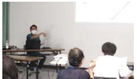
高齢化と介護の現状もわかりやすく

今回は「転倒防止」に焦点をあてていましたが、それを実現するためには普段から実際に夜明地区で実施されている健康サロン、通いの場、3B体操等が非常に有効なことがわかりました。人が集まって話すことは、それ自体が脳トレになり、あと十分な栄養がとれればそれだけで転倒予防になるという説明に、参加者は大きくうなずいていました。